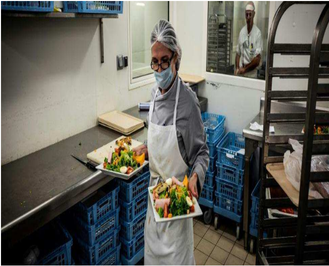
Hôpitaux, maisons de retraite: quand le "fait maison" dame le pion à la restauration collective

"Manger un repas beau, bon, chaud, que l'on a choisi" contribue à la guérison, estime-t-on au Centre de cancérologie Léon Bérard à Lyon, qui sert du mixé fait maison, varié et frais, en lieu et place des menus uniques et décongelés de la restauration collective.